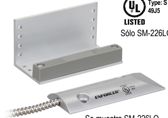
Se muestra SM-226LQ